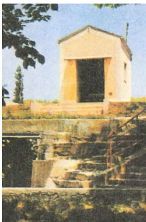
Petite chapelle de Fontanelle et la source en bas