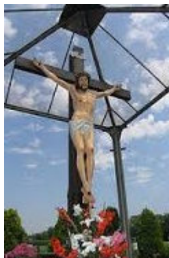
La grande Croix à Fontanelle