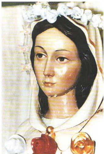
Larmes de Rosa Mistica en mai 1984 – New York

Vos larmes de sang, O Mère douloureuse, anéantissent le pouvoir de l'enfer. Que votre divine douceur, Ô Jésus enchaîné, préserve le monde de la confusion qui le menace! Amen.