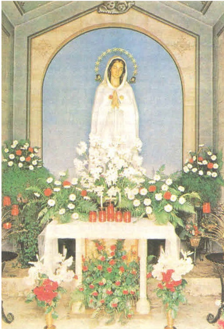
Intérieur de la chapelle