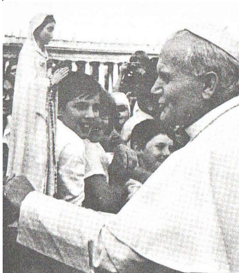
Cadeau à Jean-Paul II de la statue de la Madone « Rosa Mistica »

a toujours senti cela et s'est exprimée en d'émouvantes prières et cantiques à Marie. Par exemple; « Au paradis de Dieu, bien connu des anges, fleurit la plus belle rose de la terre sainte, de couleur et d'odeur si douces. Elle dépasse l'éclat du soleil, sa lumière perce les nuages d'une toute merveilleuse façon. » -- « La plus belle rose à laquelle je pense, qui réjouit le monde entier, c'est vous, Marie pure, bénie de Dieu! Vous, Fille du Père, vous vraie Mère de Jésus Christ, vous, Épouse de l'Esprit Saint! »