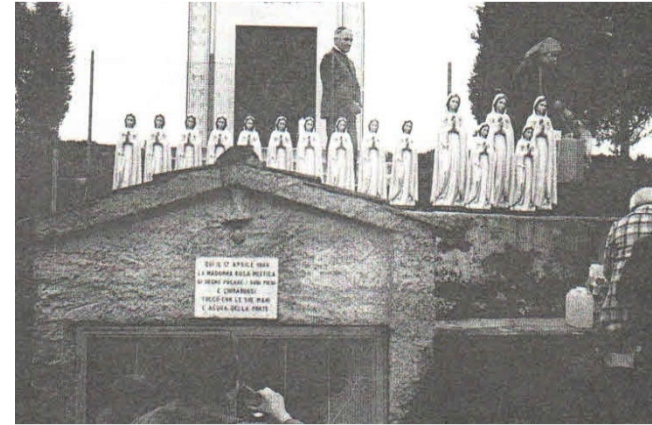
Des statues pèlerines près des sources à Fontanelle