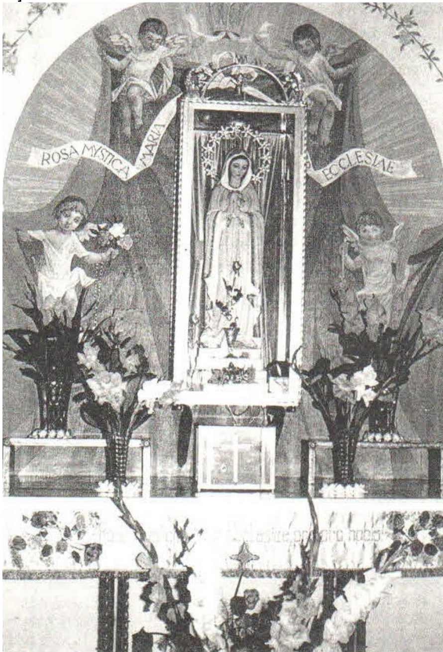
Oratoire de Pierina