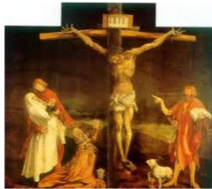
La Garde d'Honneur, c'est VIVRE : "L'HEURE DE PRÉSENCE AU CŒUR DE JÉSUS"

La Garde d'Honneur du Sacré Cœur a : 1. pour point de départ le Calvaire où Jésus sur la Croix a le Cœur ouvert et transpercé par la lance du soldat, un Cœur qui est toujours vivant mais continuellement blessé par nos péchés. 2. pour modèles la Très Sainte Vierge Marie, Saint Jean et Sainte Marie Madeleine, les premiers Gardes d'Honneur qui se tiennent au pied de la Croix.